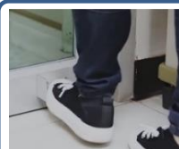
FXSUO-0302AK(引戸用) 定価 800円(税抜)